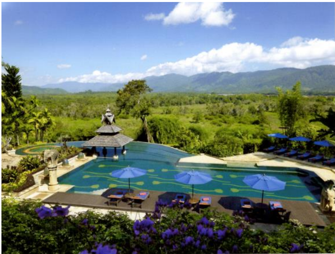
ジャングルを見開くメインプール。広大な庭園はランナー様式を得意とするビル・ペンズリー設計の「美意識庭園」

Eco-Friendly The World of Flora and Fauna