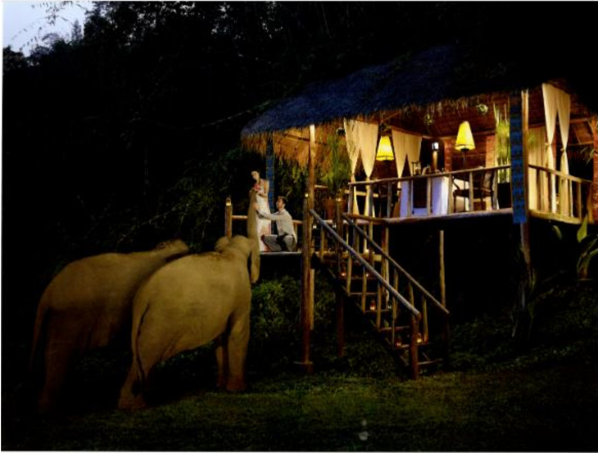
テラーメイド・ダイニング "Dining by Design" もリクエスト可能。写真はエレファントキャンプ "Thida Camp" にて