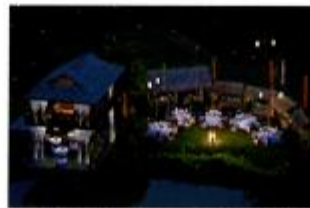
段々畑の田んぼに作られている情緒あふれるダイニング施設「ライス・パティ・タイ・ビレッジ」