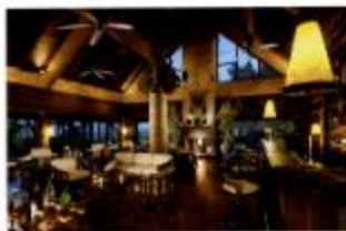
「Elephant Bar and Opium Terrace」の夜景。夕暮れ時には照明が落ちた大人の静かな空間に

にとどめ、野生との共存を表明している。運営政策の枠組みであるサステナブル・マネージメントは国際条約に準じ、地元住民の文化伝統を尊重。館内の水やエネルギー消費の削減、温室効果ガス対策、廃棄物管理、有害物質や汚染物質の除去など、このリゾートは最大限の環境対策に取り組んでいる。