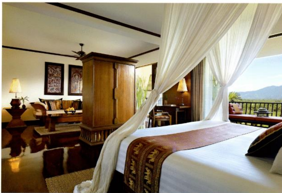
「スリーカントリービュー・スイート」の客室からはラオス、ミャンマー、そして自国タイに接する国境を見渡せる

Eco-Friendly The World of Hotels and Resorts